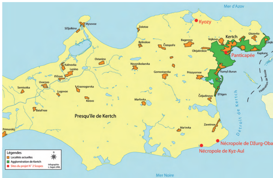
2. Carte de la presqu'île de Kertch (Infographie: L. Saget/IASA).