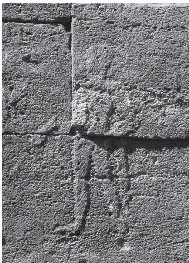
Fig. 2. Kertch, nécropole de Kyz-Aul, personnage à l'épée (?) situé sur la paroi d'entrée du tombeau.