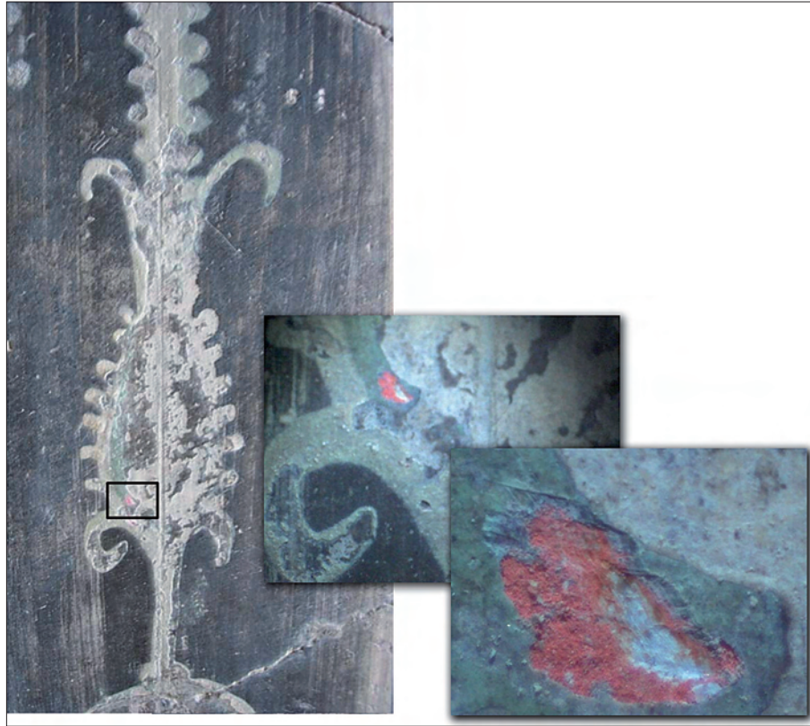
1. Ercolano, Casa dei Cervi, ambulacro 29, parete est, elemento decorativo bianco su fondo nero. Sotto lo strato bianco, pigmento a base di cinabro (osservazioni con microscopio a diversi ingrandimenti del cinabro).