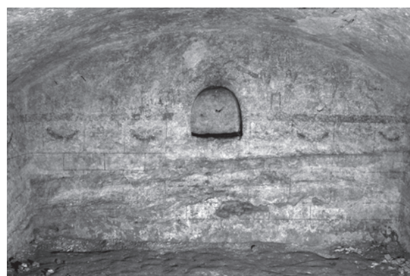
Fig. 3. Kertch, paroi arrière du tombeau de 1891.

Le site de Kyozy s'étend sur une éminence rocheuse au nord de la presqu'île de Kertch. La nécropole de l'établissement antique était d'emplacement inconnu jusqu'à ce qu'un tombeau peint y soit découvert par Alexandr Ermolin en 2001. Ce tombeau monumental, taillé dans la roche à une profondeur de 2,50 m, est composé d'une chambre funéraire maçonnée précédée d'un dromos. Les parois et le plafond du tombeau ont été stucqués et peints (Fig. 1): des pilastres aux bases reposant sur une frise blanche compartimentée en carreaux oblongs rythment la surface des murs. Sous la frise, une plinthe ocre. Des panneaux orthogonaux ordonnés entre les pilastres sont décorés d'imitations de marbre gris bleu, rouge et rose; ils sont entourés d'une bordure jaune clair et comprennent chacun un losange. Les pilastres supportaient une corniche à denticules dont les restes ont été retrouvés à terre. Un semis d'éléments végétaux, feuilles vertes et pommes rouge rose, recouvre le plafond. Si le tombeau était pillé de longue date, les restes du banquet funéraire ont offert une moisson importante de tessons