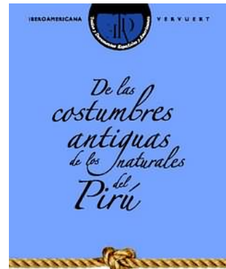
CHIARA ALBERTIN (ED.)

Borregán, Alonso: La Conquista del Perú. Edición de Eva Stoll y María de las Nieves Vázquez Núñez. Con un estudio introductorio de Wulf Oesterreicher. (Textos y Documentos Españoles y Americanos, 7) 2012, 216 p., €24,00 ISBN 9788484896357