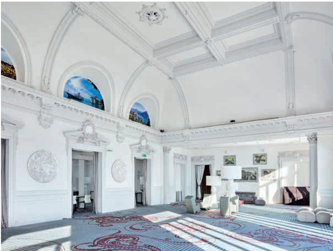
Fig. 5 Ancienne salle à manger du Sanatorium du Mont-Blanc, état actuel. Le décor polychrome d'origine a disparu mais subsistent le volume et les éléments sculptés. Photo Dirk Weiss, 2021