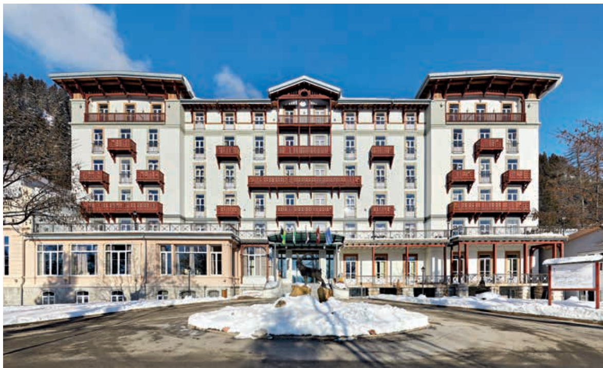
Fig. 3 Le Sanatorium du Mont-Blanc. De gauche à droite: l'aile du jardin d'hiver (disparu), le premier hôtel (1895), la salle à manger et le second hôtel (1898). Photo Dirk Weiss, 2021