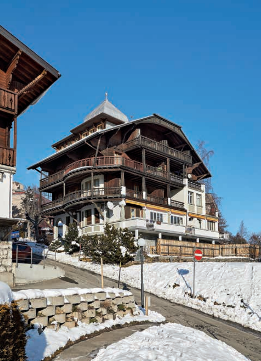
Fig. 10 La pension Quisisana, par René Longchamp, 1913. Une clinique camouflée sous une façade régionaliste. Photo Dirk Weiss, 2021