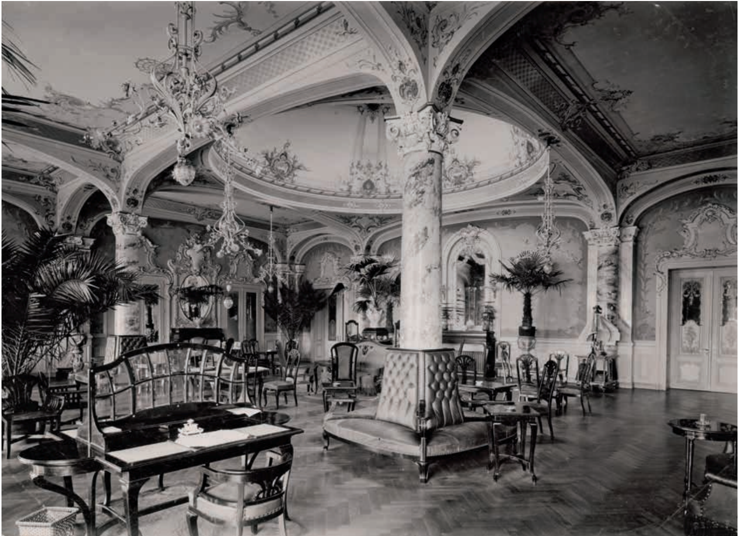
Fig. 4 Le jardin d'hiver du Grand-Hôtel, état vers 1910.