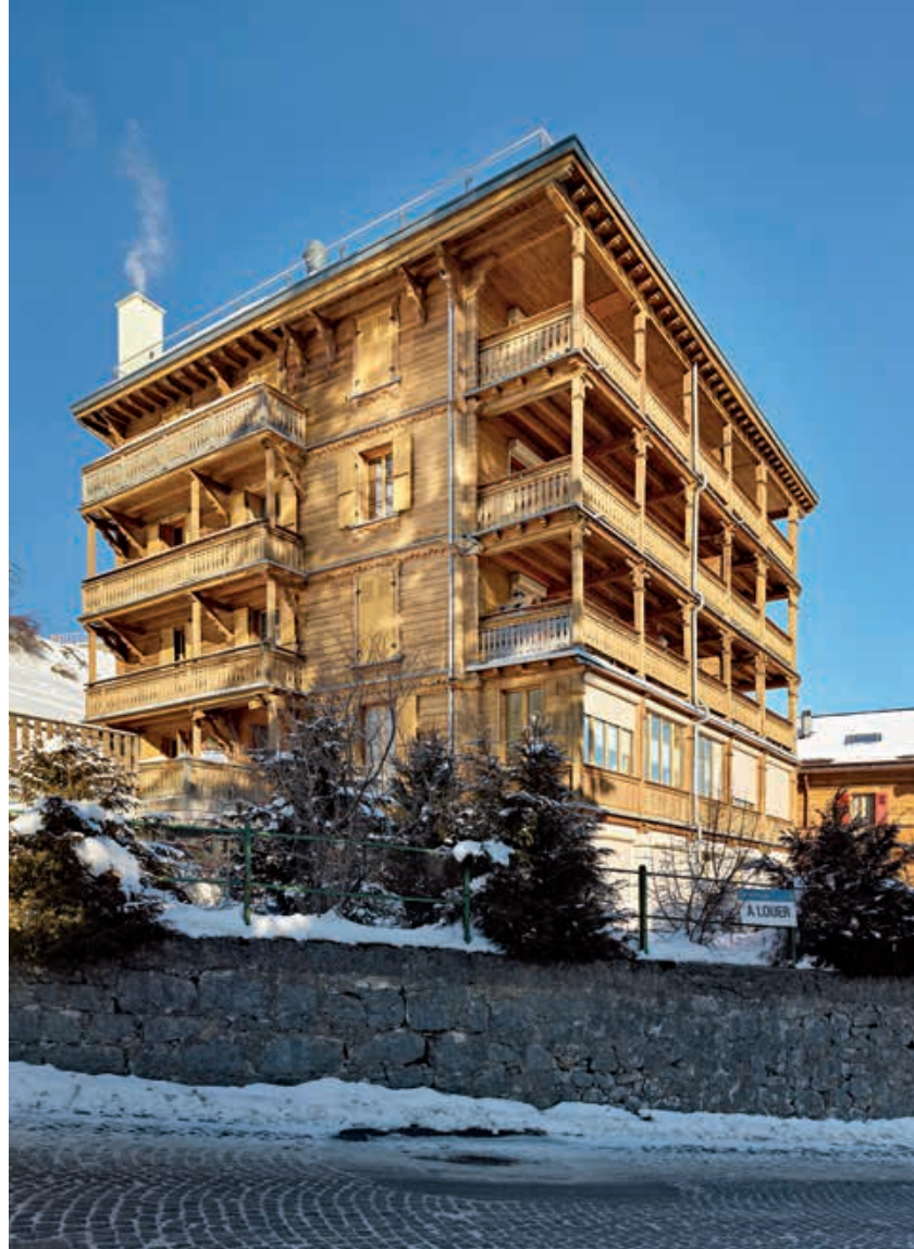
Fig. 11 La clinique Les Arolles, aujourd'hui reconverte en appartements. Photo Dirk Weiss, 2021

« helvétisante », dotée de motifs censés évoquer le style alpin. Le goût marqué pour les éléments pittoresques valorise les effets de saillie, l'usage de matériaux colorés et variés, de tourelles, de clochetons et de bow-windows, éléments qui s'accordent assez bien avec l'image qu'on se fait alors de l'architecture suisse traditionnelle. Si plusieurs cliniques endossent la forme de chalets, à l'instar du Chalet des Enfants (1891 et 1897, démoli en 2020) avec ses toits à faible pente et son décor de bois découpé, d'autres misent sur une image plus complexe. La pension Quisisana, due à René Longchamp (1913) (fig. 10), est l'un des meilleurs exemples du Heimatstil médical. Le bloc d'habitation, animé par des décrochements et des saillies (un bow-window à deux niveaux, la cage d'escalier à l'arrière), se caractérise par l'asymétrie de ses façades et la diversité des motifs employés : grand Rüнди bernois, tourelle à bulbe grison, arcades en anse de panier portées par des colonnes galbées rappelant certains châteaux valaisans... D'autres chalets et pensions puisent dans ce répertoire aux accents patriotiques avec plus