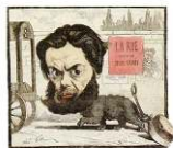
3. Jules Vallès par Gill (1867)