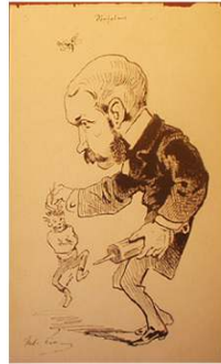
7. "Diapirus" réalisé à l'asile de Charenton (date inconnue)