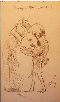
8. "Hommage à Minerve" inédit réalisé à Charenton (date inconnue)