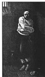
5. "Le Fou" exposé au Salon de 1882