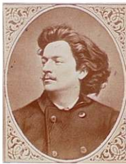
1. André Gill à 25 ans