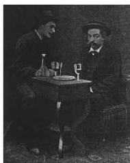
4. Emile Cohl visitant Gill à l'asile de Charenton (1884)