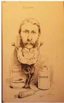
6. "Revanche" réalisé à l'asile de Charenton (date inconnue)